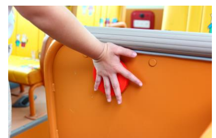
(図4) SOS ボタン